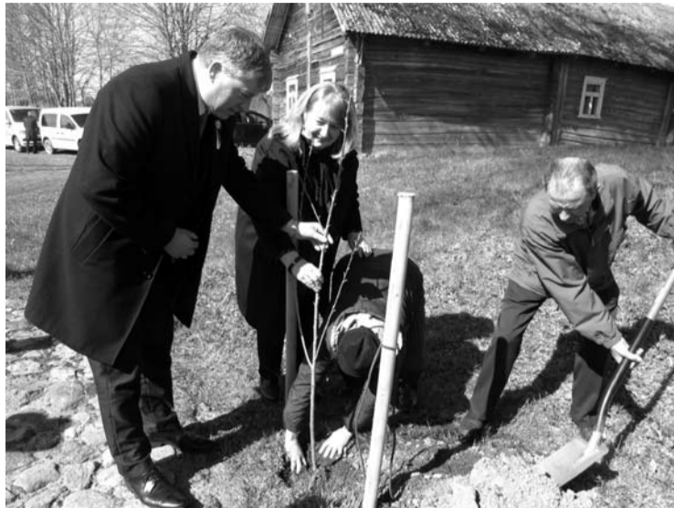
Užunvėžiuose pasodintos dvi sakuros.

Netoli Užunvėžių Antruosiuose Kurkliuose, augęs Anykščių vice-