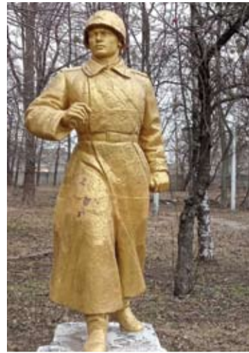
Aukštinis paminklas kariui išvadotojui Charkove.