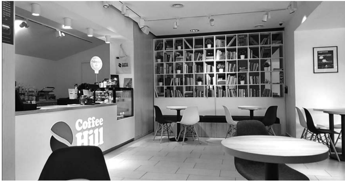
Anksčiau Anykščių kultūros centro fojė veikė „Coffe Hill“ kavinukė.

Anykščių kultūros centras kreipėsi į Anykščių rajono tarybą su prašymu leisti išnuomoti fojė esančias 56,46 kv.m ploto patalpas maitinimo ir gėrimų teikimo veiklai. Balandžio 28 dieną, ketvirtadienį, posėdžiavusi Anykščių rajono taryba nusprendė šias patalpas nuomoti, taikydama 1 Eur už kv.m įkainį.